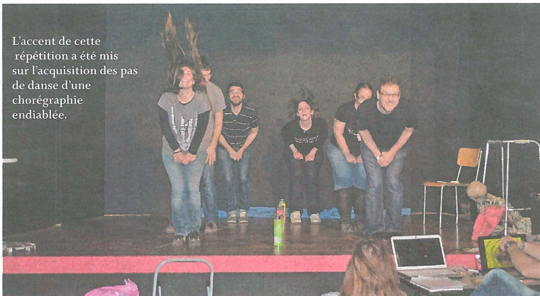
L'accent de cette répétition a été mis sur l'acquisition des pas de danse d'une chorégraphie endiablée.

GOLLION Ils ne la supportent plus cette chorégraphie pour le final qu'ils ont répété, répètent et répéteront encore jusqu'à ce qu'elle soit enfin totalement maîtrisée. Ce sont les six comédiens (ou «comédons», comme ils aiment dire) de la bande du Café-Théâtre de Gollion. Ce soir-là, c'est répétition à la mythique petite salle théâtrale du village. Sur scène, les pas de danse s'enchaînent avec énergie et de manière encore un peu maladroite mais les critiques constructives fusent et la «choré», reprise après reprise, commence à prendre jolie tournure. Réjouissant!